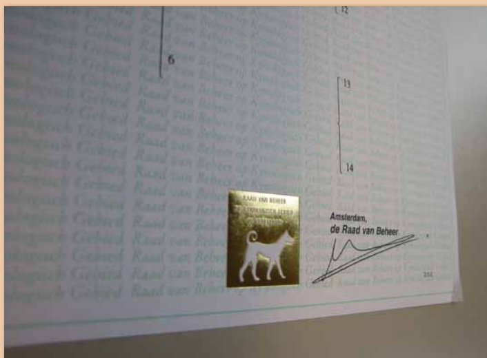
Stamboom: niet alleen afstamming, maar ook inzicht in kwaliteit door normen-matrix

Een voorstel tot besluitvorming wordt nu voorbereid en de leden besluiten hierover in 2012.