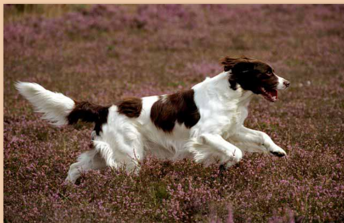
De rasstandaard van de Nederlandse rassen krijgt extra aandacht.

Dit project is gestart met drie rassen te weten Saarlooswolfhond, Dashond en Golden Retriever. Er is een klankbordgroep met vertegenwoordigers uit alle belangrijke externe partijen inclusief de rasverenigingen van de drie betrokken rassen. De eerste bijeenkomst van de klankbordgroep heeft inmiddels plaatsgevonden.